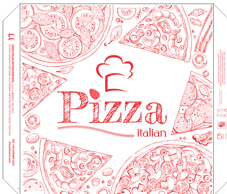
IMMAGINE E DISEGNO TECNICO