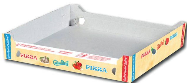
IMMAGINE E DISEGNO TECNICO