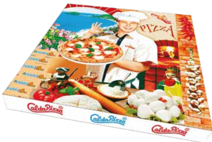
IMMAGINE E DISEGNO TECNICO